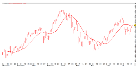
IPO Renaissance ETF vanaf november 2013 t/m heden

De lagere top in de IPO ETF en nieuwe herstel poging na bovenvermelde publicatie komt niet als een verrassing (zie onder bijgewerkte koersgrafieken t/m hedenmiddag). De koersanalogie continueert !